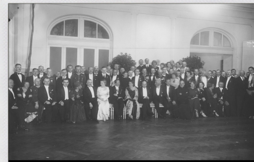
Raut z okazji otwarcia plant im. Kościałkowskiego, 1935 r.

W 1934 r. Kościałkowski został mianowany na stanowisko komisarzowego prezydenta Warszawy. Opuścił Białystok 28 lutego, żegnany na dworcu przez licznych reprezentantów lokalnej społeczności, która liczyła, że były wojewoda do miasta jeszcze powróci. Tak się jednak nie stało. Kościałkowski jako wojewoda świetnie się sprawdzał i pozostawił po sobie bardzo dobre wrażenie. Nic zatem dziwnego, że niedługo później, bo już 4 września 1935 r. (podczas uroczystości otwarcia plant), otrzymał jako drugi po Józefie Piłsudskim honorowe obywatelstwo miasta.