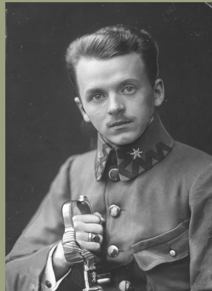
MARIAN ZYNDRAM-KOŚCIAŁKOWSKI (16.03.1892-12.04.1946)

żołnierz, polityk, premier wojewoda białostocki w latach 1930-1934