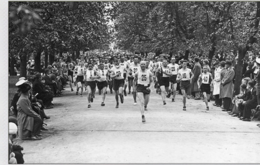
Bieg przetajowy o puchar wojewody i "Dziennika Białostockiego", 1933 r.

W okresie międzywojennym w Białymstoku odczuwalny był brak towarzystw sportowych zdolnych do organizowania rozgrywek na wysokim poziomie. Kościałkowski, świadom korzystnego wpływu sportu, zorganizował 27 stycznia 1932 r. spotkanie, które doprowadziło do powstania Białostockiego Klubu Sportowego Jagiellonia. Sam wojewoda objął w nim funkcję honorowego prezesa. Swoją pierwszą mecz Jagiellonia rozegrała z lokalnym rywalem - Żydowskim Klubem Sportowym Białystok, wygrywając go 4:2.