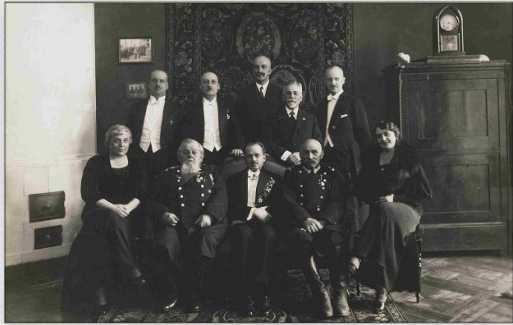
Pamiętkowe zdjęcie w gabinecie wojewody (Pałac Branickich), 1933 r.

9 lipca 1930 r. Marian Zyndram-Kościałkowski, po ponad ośmiu latach pracy w polskim parlamencie, został mianowany wojewodą białostockim. Do Białegostoku przybył już następnego dnia i zamieszkał w pałacu Branickich, ówczesnej siedzibie Urzędu Wojewódzkiego. Z przyjazdem nowego wojewody wiązano duże nadzieje i - jak się później okazało - słusznie. Kościałkowski w swoich działaniach skupiał się na zagadnieniach gospodarczych oraz walce z bezrobociem. Regularnie odbywał podróże inspekcyjne, wizytując wszystkie podległe mu powiaty.