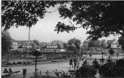
Aleja Mariana Zyndrama Kościałkowskiego w Białymstoku, lata 30.

Wojewoda przykładał też dużą wagę do kwestii odpowiedniego wyglądu Białegostoku jako wizytówki województwa. W okresie jego rządów rozpoczęto zakrojoną na szeroką skalę reorganizację przestrzeni miejskiej. W okolicach Urzędu Wojewódzkiego miała powstać dzielnica reprezentacyjna z siedzibami większości urzędów. W kwietniu 1933 r. zapadła decyzja o utworzeniu w części historycznego parku Branickich publicznych plant - bulwarów. Ich uroczyste otwarcie odbyło się 4 września 1935 r., a same bulwary miały nosić imię byłego wojewody.